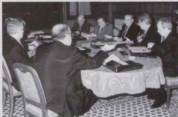
Reunión del Jurado del Premio «Reina Sofía» de Poesía Iberoamericana.